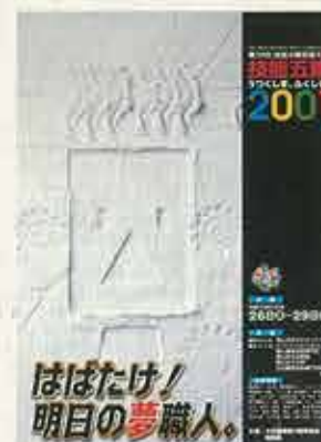
技能五輪うつくしま、ふくしま。