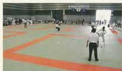
財団法人日本柔道整復師会第49回東北ブロック大会福島県大会