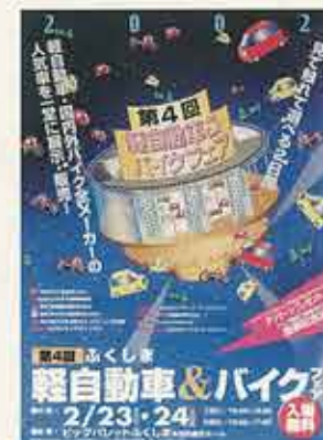
軽自動車&バイクフェア