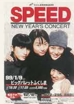
SPEED NEW YEAR'S コンサート