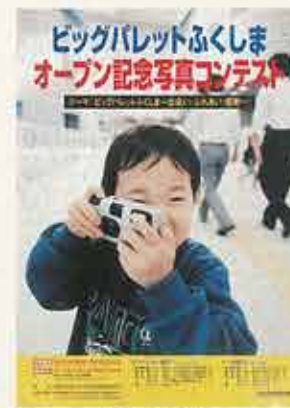
オープン記念写真コンテスト