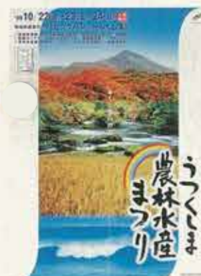
うつくしま農林水産まつり