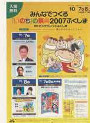
みんなで作る「いのち」の祭典