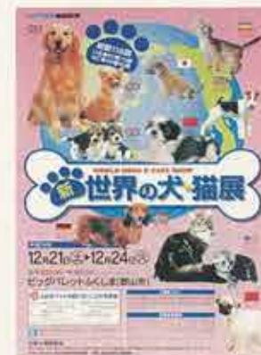
新世界の犬・猫展