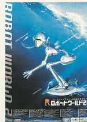
ロボットワールド21