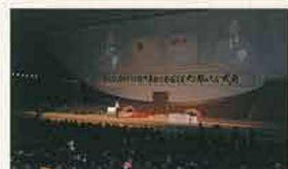
(社)日本青年会議所第55回全国会員大会郡山大会 常陸宮ご夫妻ご臨席