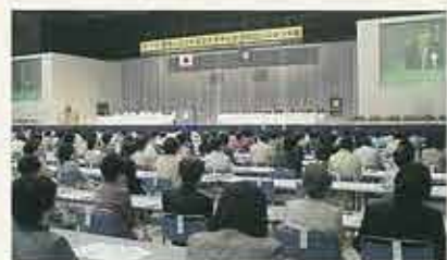
第17回国際ソロプチミスタメリカ日本北リジョン大会