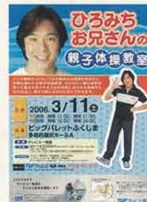
ひろみちお兄さんの親子体操教室