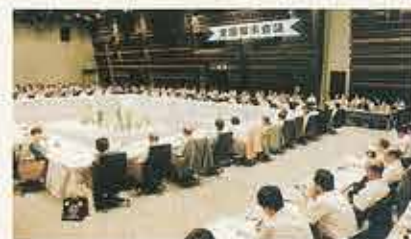
平成13年度全国知事会議