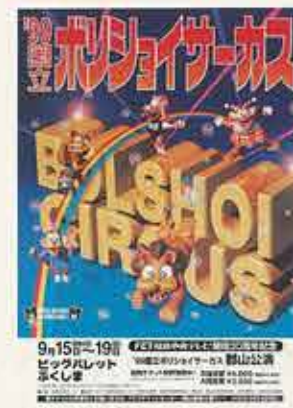
国立ポリショイサーカス