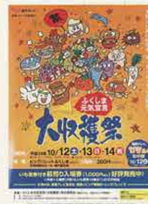
ふくしま元気宣言 大収穫祭