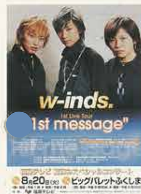
w-inds. "1st message"