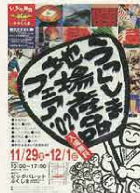
うつくしま地場産品フェア