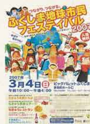
ふくしま地球市民フェスティバル