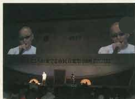
サンプラザ中野スペシャルコンサート