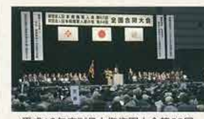
平成18年度財団法人日本傷痍軍人会第62回・財団法人日本傷痍軍人妻の会第44回全国合同大会