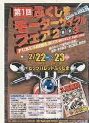
ふくしまモーターサイクルフェア