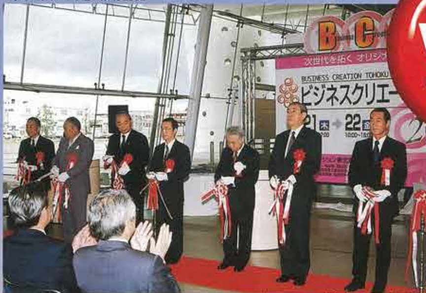
ビジネスクリエーション東北2002