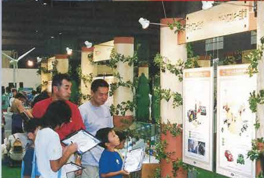
新エネ・フロンティア21 クリーンエネルギー フェスタ in 郡山